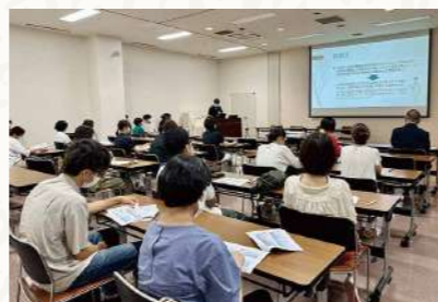
2023年 ICT西胆振感染対策ネットワークでの事例紹介の様子