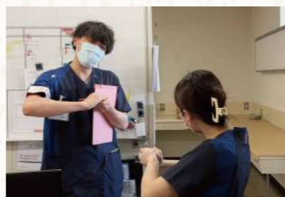
ICTラウンドで職員の手指消毒手順を抜き打ちチェック