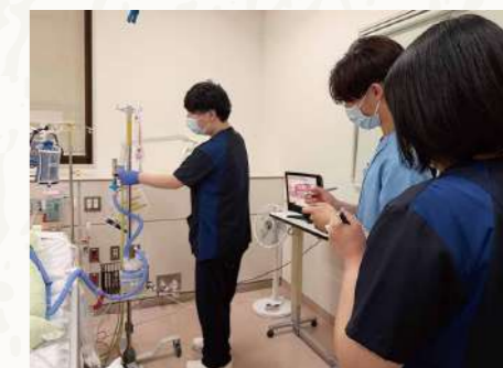
ICUでネーザルハイトフロー(酸素投与装置)の調整方法を教育

現在では、ICUにおける特定行為研修修了看護師としての業務のほか、看護師教育も担当しています。「新人看護師へのフィジカルアセスメント教育なども担当しています。特定行為研修で得た様々なリソースは臨床の現場へどんどん還元しているのですが、新人教育もその一端と考えています。」と話し、新人看護師のオリエンテーション研修で講義を担当するほか、リソースナースとしての活動も精力的に活動しています。「新人看護師だけでなく、これから特定行為研修の修了を志す看護師の新たなキャリアパスの手本になれば、と思っています。」