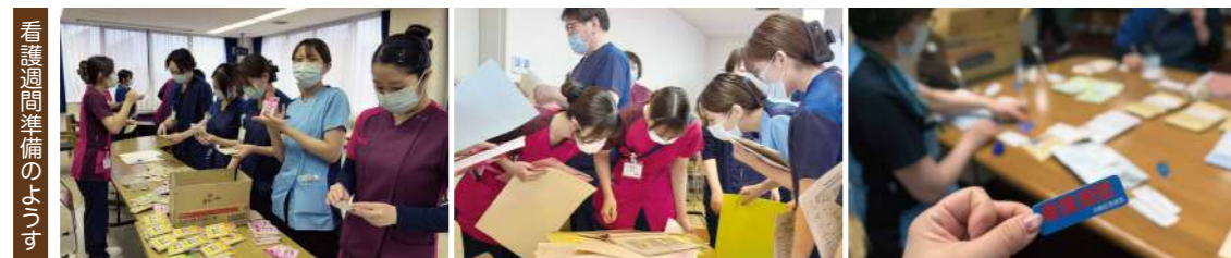
オリジナルポケットティッシュづくり 展示パネルづくり 看護週間バッジの振り分け作業

「近代看護の祖」と呼ばれるフローレンス・ナイチンゲールの誕生日にちなみ、5月12日は看護の日、そしてこの日を含む日曜日～土曜日は看護週間とされています。今年の看護週間は5月10日(日)～16日(土)でした。当院では、看護の日が制定された1990年の翌年から、看護週間に合わせて看護のすばらしさや看護の仕事を周知すべく、イベントを実施しています。今年は5月13日(水)に外来ロビーで健康チェックや看護の日パネル展、院内保育園ぷぶにえの園児たちによるちびっこナース（ポケットティッシュ配布）を行いました。