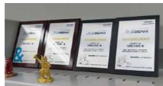
一番右が今回贈呈された盾

放射線治療に使用されているリニアック（Varian社製 True Beam）が連続稼働3000日を達成し、Varian社から記念の盾が贈られました。この盾は計測起算日となる2017年8月24日から連続稼働500日ごとに贈呈されています。装置の長期連続稼働には日々の品質検査に加え、毎日・毎週・毎月の定期点検が欠かせません。患者さんへの安定した質の高い放射線治療の提供に向け、当院は今後も細やかな機器保守を継続してまいります。