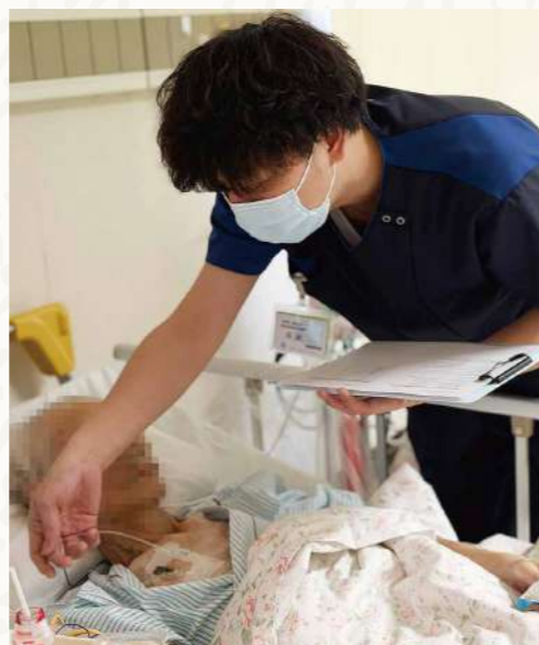
入院患者さんのCVポートの状態を確認中