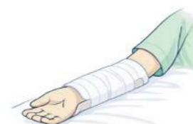
整形外科でのシーネ固定