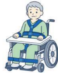
立ち上がりやずり落ちないように、からだを固定したりテーブルをつける