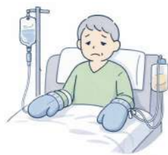
点滴チューブを抜いたり皮膚をかかないようミトンをつける