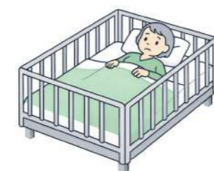
自分でベッドから降りられないようにする