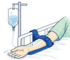
点滴チューブを抜かないよう四肢を固定する