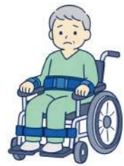
徘徊・転落しないように、車椅子や椅子、ベッドにからだを固定する

患者さんの自由を制限し、尊厳を阻む行為 …… 身体拘束や、薬物による過度な鎮静など