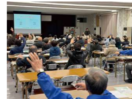
▲ 室蘭港立市民大学