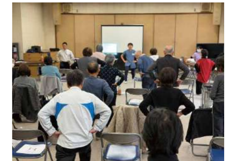
▲ 宮の森・知利別地区福祉協議会

50名以上の大規模な企画では、過去の開催ゼミのテーマにおける実施ほか、開催趣旨に合わせたプログラム検討も行いました。