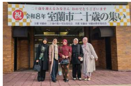
日本文化を体験することで外国人籍スタッフたちは入所者さんへの理解を深めています。 (写真は成人式への参加の様子)