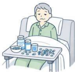
行動を落ち着かせるために向精神薬を過剰に服用させる