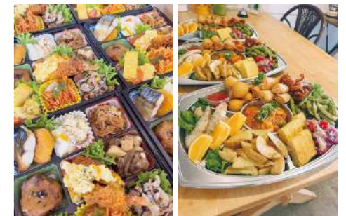
彩り豊かなお弁当は栄養バランスがバッチリオードブルにも対応しています