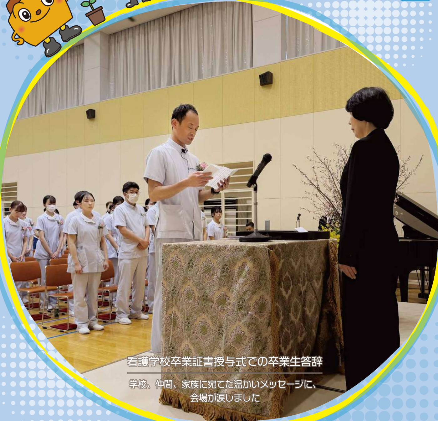
看護学校卒業証書授与式での卒業生答辞