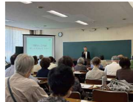
▲ 登別ときめき大学